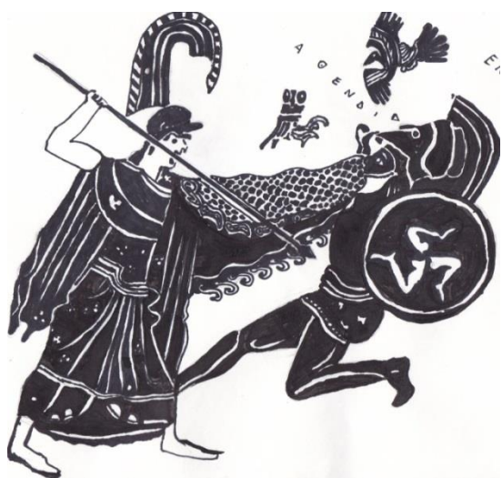
Kristīne Emsiņa, 10.a 1.attēls