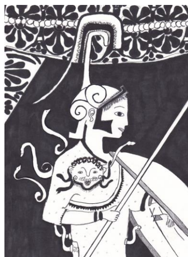
Inga Birzgale, 10.a 2.attēls