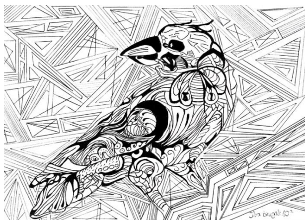
Ilva Birzgale, 10. a 3.attēls