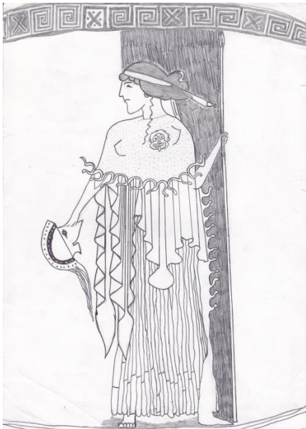
Elīna Lasmane, 10.b 7.attēls