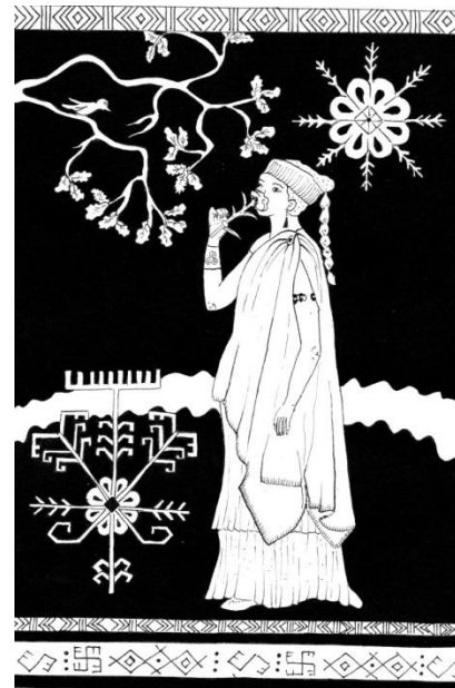
Olīvija Tija Ķeruze, 10.b 8.attēls