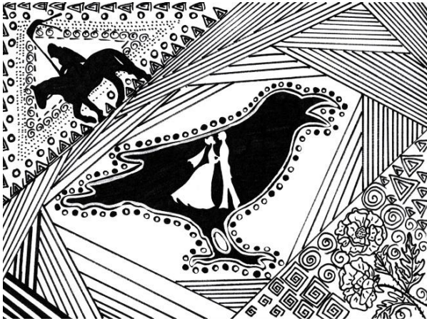
Evelīna Karple, 10.b 5.attēls