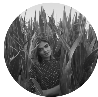
Torija Rače " Žetonvakars "

Šī tradīcija ne tikai pilnveido mūs dažādās jomās, bet arī dod iespēju uz brīdi iziet no rutīnas, kā arī izjust sacensību garu. Tas ļauj izcelties uz apkārtējā fona, un ar katru gadu izvirzīt labākus un augstākus mērķus.