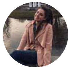
KITIJA BARTONIKA “ KULTŪRAS BAUDĪJUMS ”

Kad pamatskolas basketbola komandām uzvarētāji tika noskaidroti, sākās vidusskolas basketbola turnīrs. Vispirms tika aizvadīts puīšu turnīrs, kurā bronzu ieguva 11.a klase, bet ļoti spraigajā un karstasinīgajā finālā 12.d klases puīši piekāpās 12.c. Interesanti ir tas, ka šī bija vienīgā spēle visā turnīrā, kur uzvarētājs bija jānoskaidro ar papildlaika palīdzību. Savukārt meiteņu cīņās titulēja 11.b klases meitenes, 2.vietā atstājot 11.c meiteņu komandu, bet 10.b klases meitenes ieguva 3.vietu.