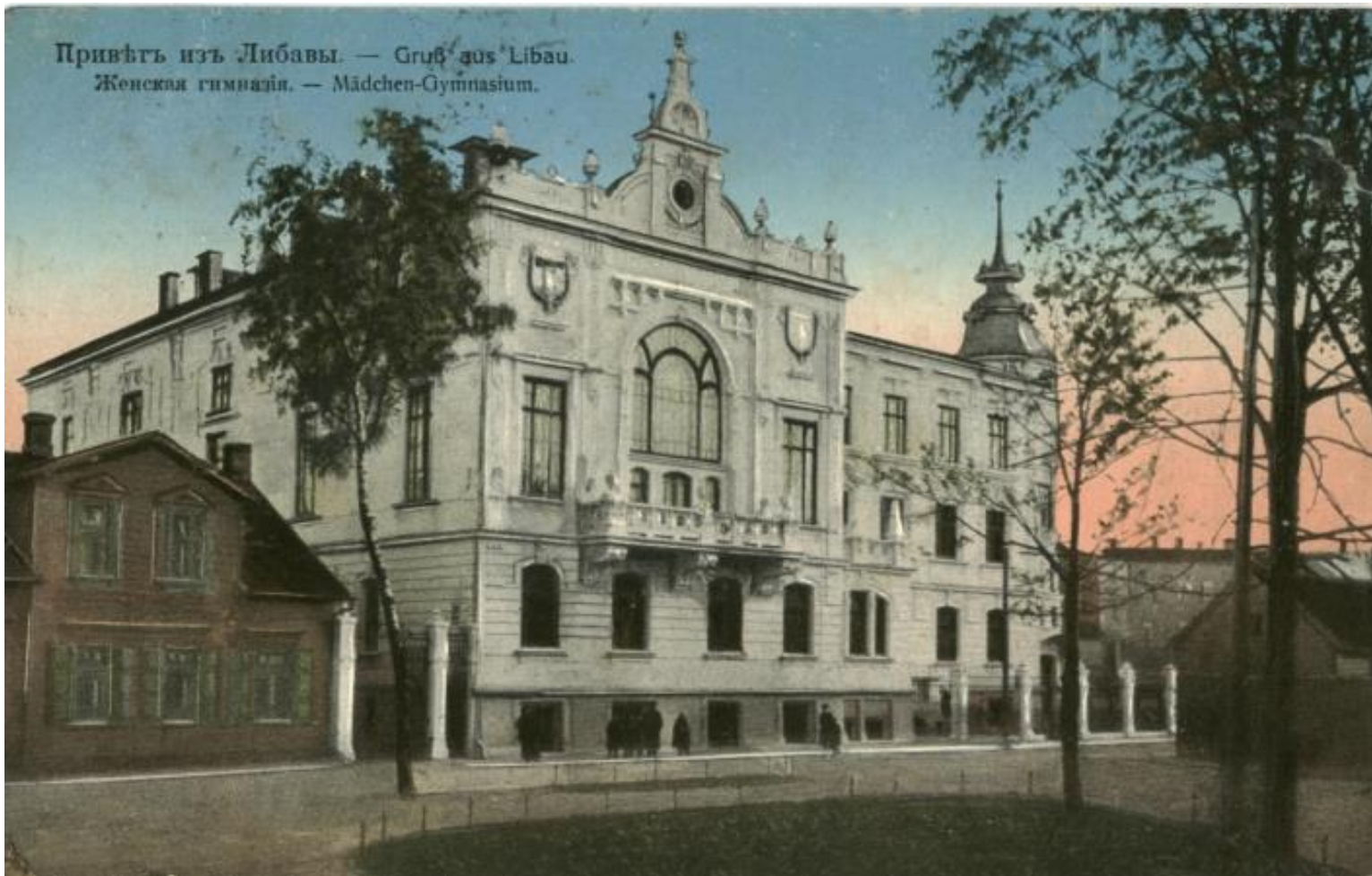
Meiteņu ģimnāzija, 20.gs sākuma pastkarte